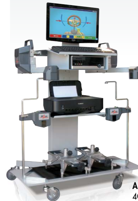
ARS 640WD 4CCD