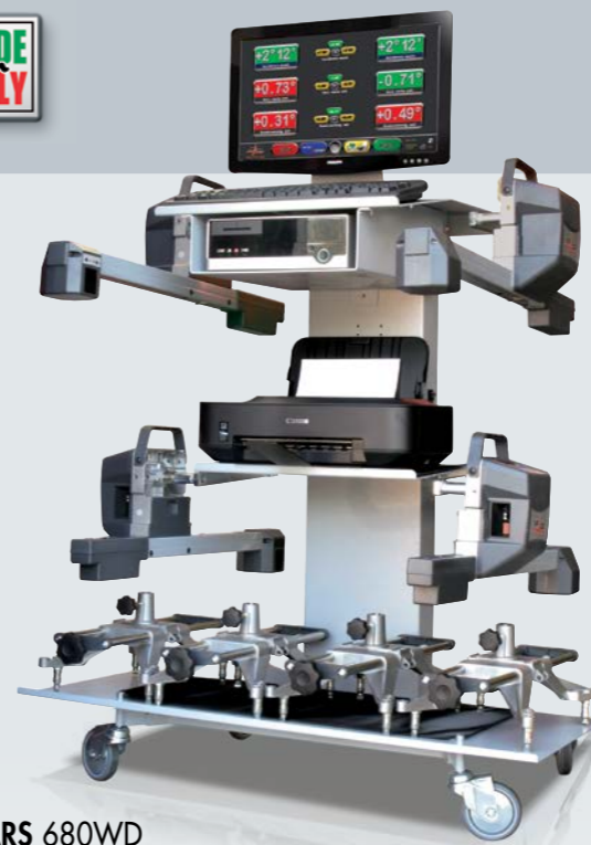
ARS 680WD 8CCD