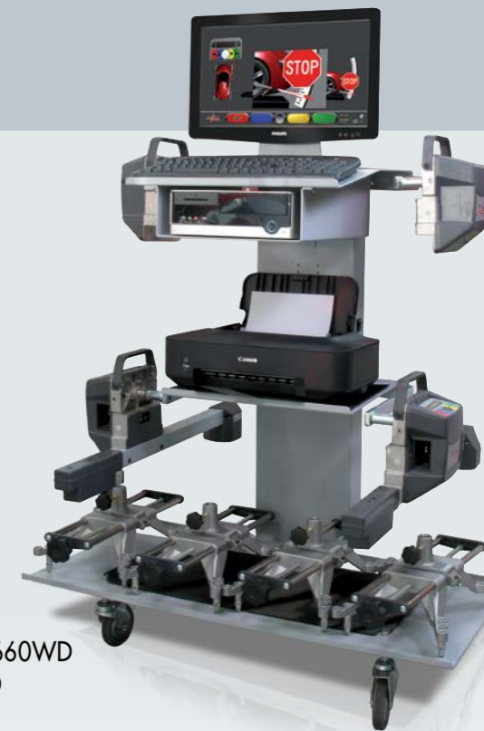
ARS 660WD 6CCD