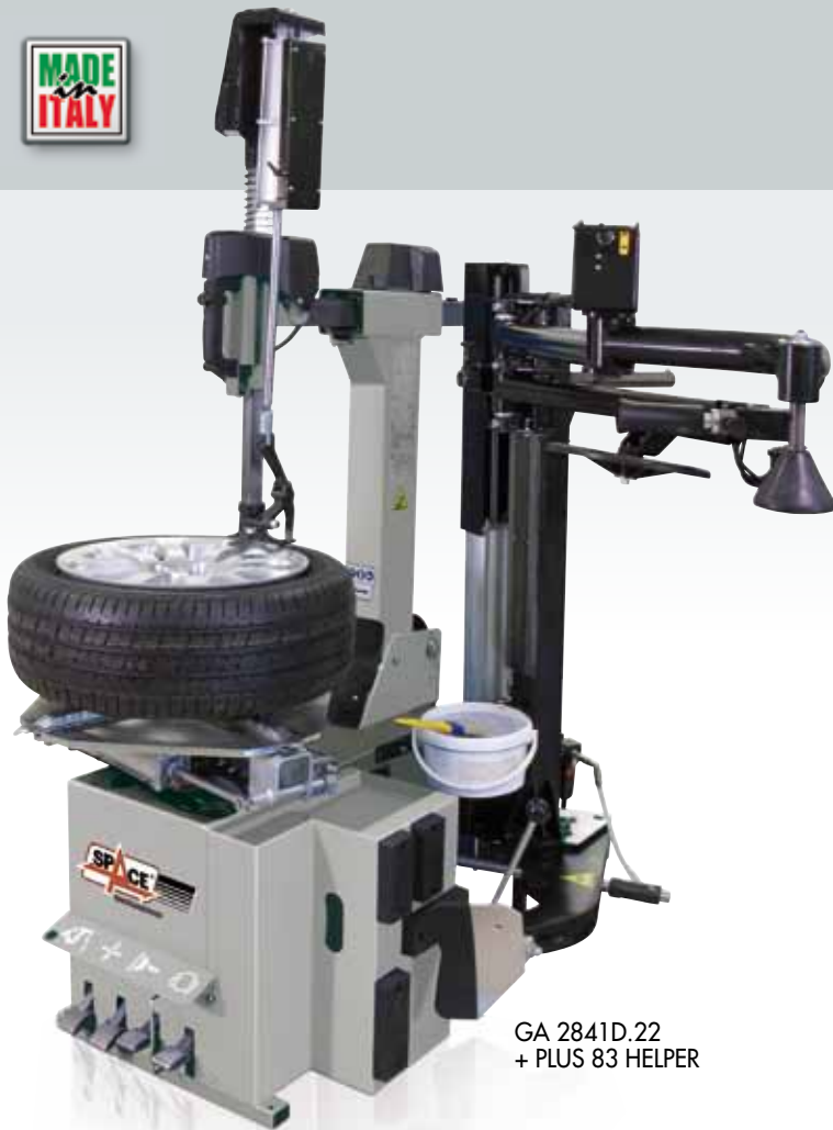
GA 2841D.22 + PLUS 83 HELPER

COMPANY WITH QUALITY MANAGEMENT SYSTEM CERTIFIED BY DNV = ISO 9001:2008 =