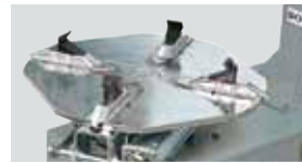
10"-18" / 10"-20" / 11"-22"