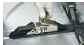
8" - 30" (4 Positions)

Mandrino autocentrante • Doppio senso di rotazione • Elevata coppia torcente • Elevata forza di serraggio (due pistoni)