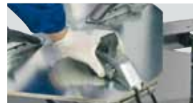
10"-24" / 10" - 26" / 10" - 28" (2 Positions)