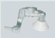
G84A23 Utensile per ruote moto Tool for motorcycle wheels Montagekopf für Motorräder Tête roues motos Útil para llantas de moto