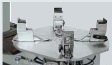
G84A5 - G84A21 Griffe per ruote moto (+ 5"). Clamps for motorcycle wheels (+ 5"). Spannklauen für Motorräder (+ 5") Griffes pour roues de moto (+ 5"). Garras para ruedas de motos (+ 5").