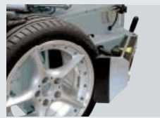
G800 A11K (5 x kit)