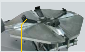
G800A5 (4 x kit)