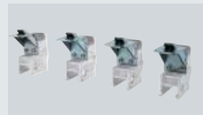
G84A24 Griffe per riduzione presa (-2"). Clamps reduction kit (-2"). Spannklauen für Drehtellerreduzierung (-2"). Griffes pour réduction de prise (- 2"). Garras para reducción de toma (-2").